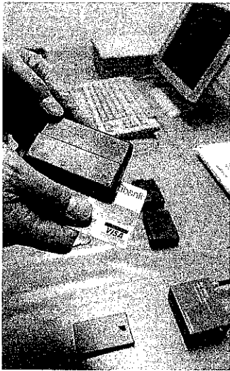
押収されたカードの磁気情報を読み取り「スキマー」などの特殊機器で1月19日午後、東京都江戸川区の葛西署