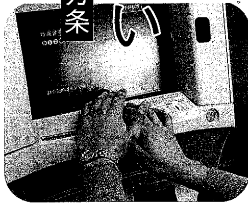
暗証番号を入力するときは、盗み見られないように注意して