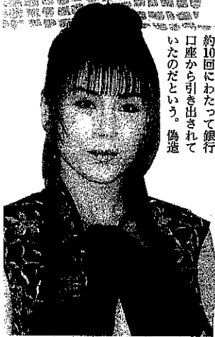
カードを持つ以上、顔にでも被害の危険が...